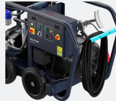
Freno, tope de inclinación y empuñaduras