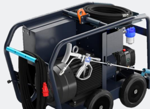
Almacenamiento de cable, lanza y manguera