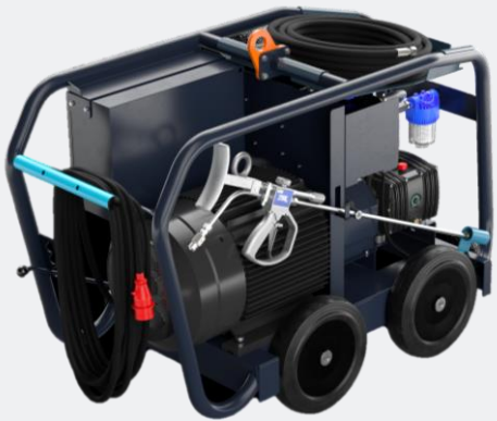
Bandeja de manguera / punto de elevación / ruedas dobles